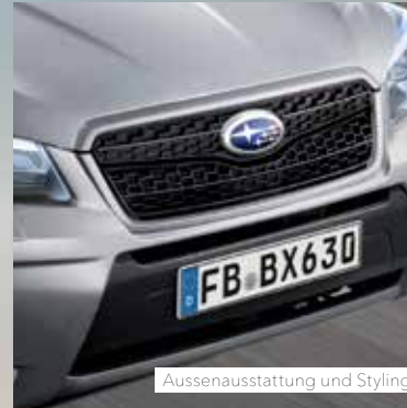
Aussenausstattung und Styling