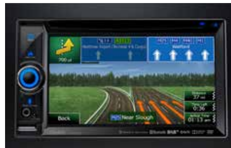
73 2DIN Multimediasystem Clarion NX505E 1290-16

2DIN DVD Multimedia-Navigationssystem mit hochauflösendem 6,2" Touch-Display. 47 Länder (Europa), TMC, Bluetooth®, Anschlussmöglichkeit für eigene Musikplayer und Mobiltelefone. Funktion Sprachsteuerung nach Umbau nicht mehr vorhanden. *Einbaumaterial zusätzlich erforderlich.