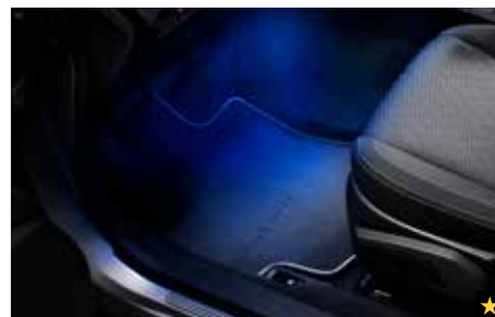
77 Innenraumbeleuchtungskit (Blau) H701SFJ001

*Nicht für die Modelle Trend und Active verwendbar.