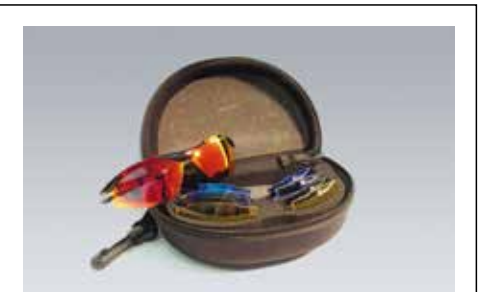
89 SUBARU Sonnenbrillenset 1343 Sportliche Sonnenbrille mit auswechselbaren Scheiben. Inhalt 5 Paar Brillengläser in den Farben rauch, klar, blau, gelb und rot. Brille mit Beutel Brillenputztuch im Etui. UV 400.