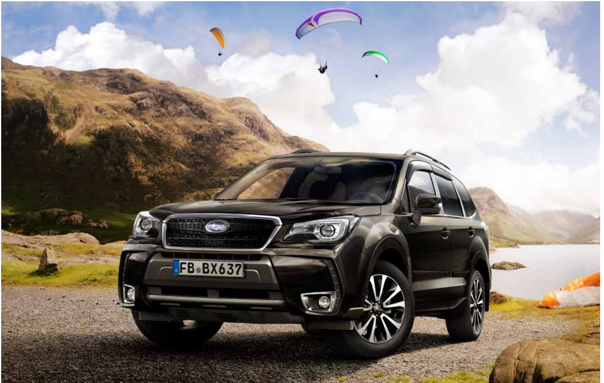
S. 7: Das Fahrzeug ist ausgestattet mit Gitterfrontgrill und Seitenwindabweisersatz.

★ Alle Artikel, die mit diesem Symbol gekennzeichnet sind, können zu Preisvorteilspaketen zusammengefasst werden. Siehe Preisliste auf Seite 18/19 und Rückseite. Die Preise der jeweiligen Artikel entnehmen Sie bitte der Preisliste auf Seite 18/19. Die Preise verstehen sich zuzüglich Montage und eventuell notwendiger Lackierarbeiten sowie TÜV-Kosten.