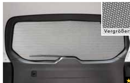
46 Sonnenschutzelement (Heckscheibe Laderaum) F505ESG000

Mittelarmstütze mit Schiebefunktion. * Nur für Lineatronic Basisversionen verwendbar. Nicht für 6-Gang Schaltgetriebe.