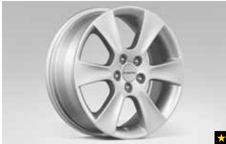
68 Leichtmetallfelge 6,5 x 16", ET 48 SECWAG4003

★Alle Artikel, die mit diesem Symbol gekennzeichnet sind, können zu Preisvorteilspaketen zusammengefasst werden. Siehe Preisliste auf Seite 18/19 und Rückseite. Die Preise der jeweiligen Artikel entnehmen Sie bitte der Preisliste auf Seite 18/19. Die Preise verstehen sich zuzüglich Montage und eventuell notwendiger Lackierarbeiten sowie TÜV-Kosten.