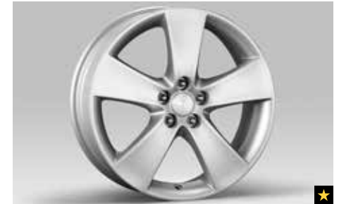
65 Leichtmetallfelge 7,0 x 17", ET 48 SECWAG4104 *Nabenkappe zusätzlich notwendig.