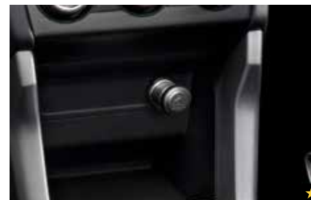
78 Zigarettenanzünder-Kit H6710SG000

Beleuchtet den Fußraum mit einem strahlend blauen Schimmer.