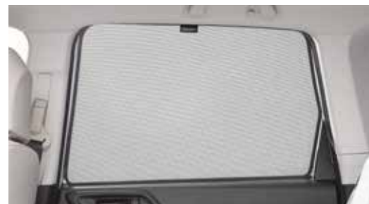
47 Sonnenschutzelemente (Seitenscheiben hinten und Seitenscheiben Laderaum) F505ESG100

Zum Schutz vor Sonneneinstrahlung und zum Abdunkeln des Laderaums.