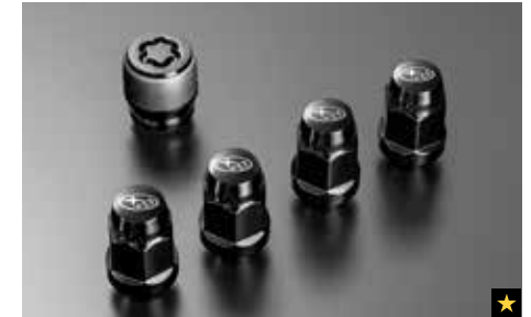
71 Felgenschloss- und Radmutterersatz-Schwarz SEMGYA4000

Diebstahlschutz für Ihre Felgen und Reifen. Besonderer Schlüssel notwendig.