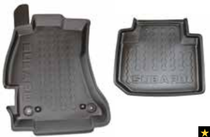
41 Fußraumwannen 1384/1385/1386/1387

Schützt den Fahrzeugboden vor Matsch und Schnee. * In Kombination mit Gummimattensatz vorne. Set für hinten.