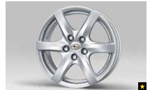
66 Leichtmetallfelge 7,5 x 17", ET 48 1247