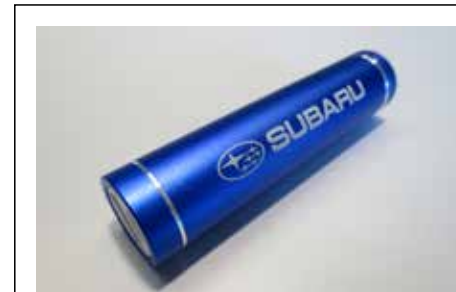
88 SUBARU Power Bank 1510-01 Auch wenn weit und breit keine Steckdose zur Verfügung steht kann damit ein Handy bequem geladen werden. Kapazität: 5.200 mAh, Lithium Ionen Akku.