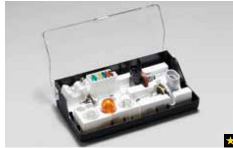
81 Reservelampenset SEHASG8020 *Xenon- und LED-Leuchtmittel nicht enthalten. Inhalt kann von der Abbildung abweichen.