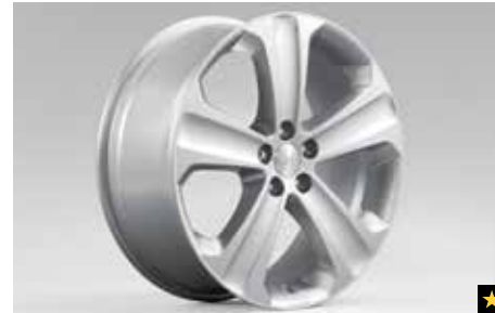
64 Leichtmetallfelge 7,5 x 18", ET 48 SECWSC4001 *Nabenkappe zusätzlich notwendig.