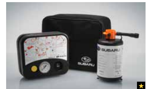
79 Reifenpannenset SETSYA4001

Der Zusatzstecker wird zum Zigarettenanzünder.