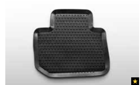
40 Gummimattensatz hinten J505ESG020

Schützt den Fahrzeugboden vor Matsch und Schnee. * In Kombination mit Gummimattensatz hinten. Set für vorne.