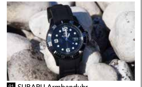
91 SUBARU Armbanduhr 1360 Schwarzes Kunststoffgehäuse, einseitig drehbare Rasterlunette, 3 ATM, Datum mit Lupe. Schwarzes, wasserabweisendes Silikonarmband mit Edelstahlornschnelle.