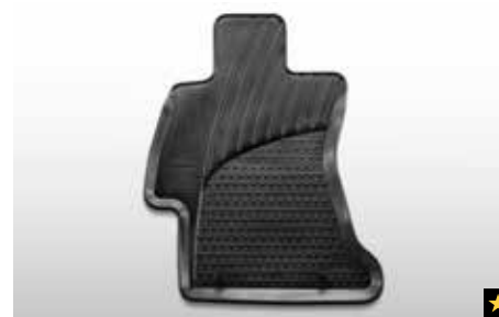
39 Gummimattensatz vorne J505ESG010

Verbessern Sie das Erscheinungsbild des Innenraums mit hochwertigen, passgenauen Teppichmatten mit Schriftzug. * Set für vorne und hinten.