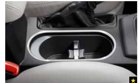
44 Chromzierleisten für den Getränkehalter J205ESG000

Hochwertige Türeinstiegsleiste aus Edelstahl mit SUBARU Schriftzug. *2-teiliges Set für vorne.