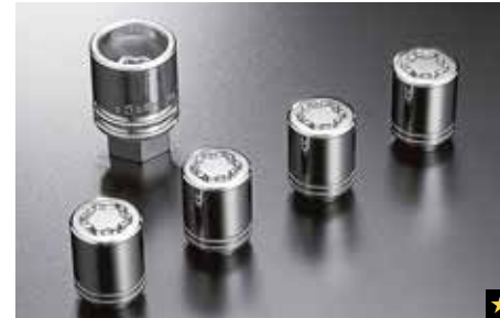
70 Felgenschlossatz B327EYA000

Diebstahlschutz für Ihre Felgen und Reifen. Besonderer Schlüssel notwendig.