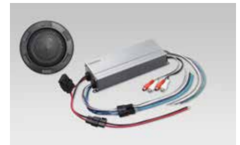
75 Sound Upgrade "Basic" 1290-35

Ermöglicht den Zugriff auf Internet Radio und mehr mit SUBARU STARLINK Infotainment-System. Steuern Sie das System mit dem tablet-ähnlichen 7 Zoll-Touchscreen-Monitor, Multifunktionslenkradbedienung oder Sprache. Wenn Sie Ihre Lieblingsmusik hören wollen schließen Sie Ihr iPhone, ein anderes Smartphone oder eine andere mobile Musikquelle über den Standard USB- oder AUX-Anschluss an. *GPS-Antenne für den Einbau zusätzlich notwendig.