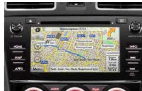
74 Original Navigationssystem 86271SG962

2DIN DVD Multimedia-Navigationssystem mit hochauflösendem 6,2" Touch-Display. 47 Länder (Europa), DAB+, Intelligent VOICE, TMC, Bluetooth®, Anschlussmöglichkeit für eigene Musikplayer und Mobiltelefone. Funktion Sprachsteuerung nach Umbau nicht mehr vorhanden. *Einbaumaterial zusätzlich erforderlich.