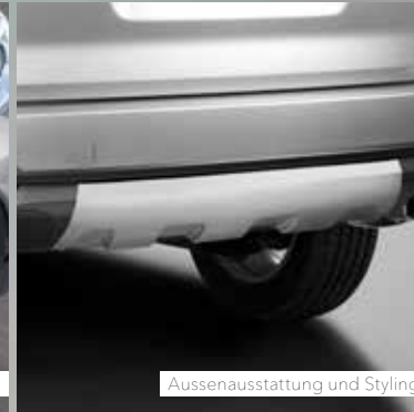
Aussenausstattung und Styling