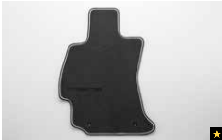
37 Teppichmattensatz vorne & hinten, Premium J505ESG200

Verbessern Sie das Erscheinungsbild des Innenraums mit hochwertigen, passgenauen Teppichmatten mit Schriftzug. * Set für vorne und hinten.