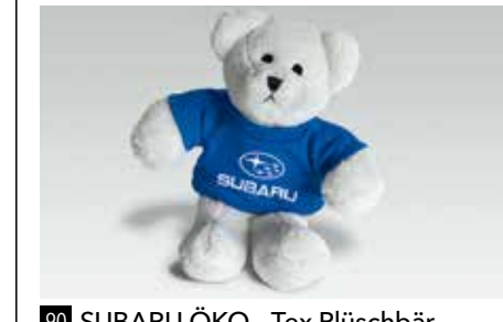
90 SUBARU ÖKO - Tex Plüschbär 2921 Flauschiger Teddy im T-Shirt zum Knuddeln.