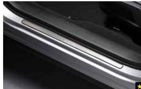
42 Türeinstiegsleistensatz Außen (Edelstahl) E101CSG500

Robuste Fußraumwannen für vorne und hinten jeweils für links und rechts. Abbildungen ähnlich.