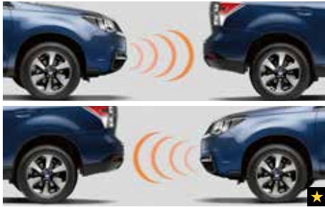
80 Ultraschall Einparkhilfen für vorne und hinten H485ESG100/H485ESG200/H485ESG000 Sicheres Einparken mit jeweils vier Sensoren durch akustische Warnungen.

★Alle Artikel, die mit diesem Symbol gekennzeichnet sind, können zu Preisvorteilspaketen zusammengefasst werden. Siehe Preisliste auf Seite 18/19 und Rückseite. Die Preise der jeweiligen Artikel entnehmen Sie bitte der Preisliste auf Seite 18/19. Die Preise verstehen sich zuzüglich Montage und eventuell notwendiger Lackierarbeiten sowie TÜV-Kosten.