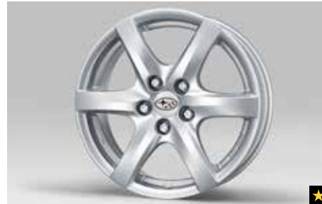
69 Leichtmetallfelge 6,5 x 16", ET 48 1246