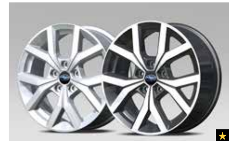
67 Leichtmetallfelge 7,0 x 17", ET 48 B311EFJ000/B311EFJ100 B311EFJ000 Silber, 7,0 x 17", ET 48 B311EFJ100 Schwarz poliert, 7,0 x 17", ET 48