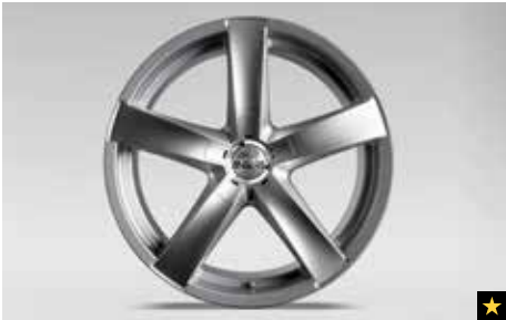
62 Leichtmetallfelge 8,5 x 19", ET 45 2919