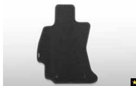
38 Teppichmattensatz vorne & hinten, Standard J505ESG100

Verbessern Sie das Erscheinungsbild des Innenraums mit hochwertigen, passgenauen Teppichmatten mit Schriftzug. * Set für vorne und hinten.