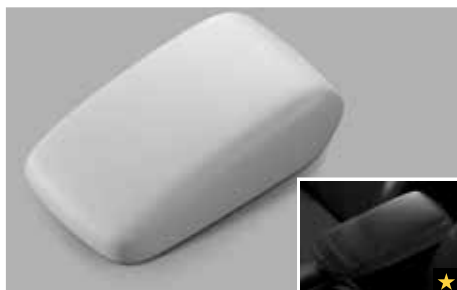
45 Mittelarmstütze (Schwarz/Hellgrau) 92114SG050JC/92114SG050LL

Ein Chromrahmen als Akzent in der Mittelkonsole.