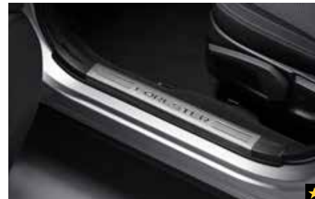
43 Türeinstiegsleistensatz Innen (Edelstahl) E105ESG000

Elegante Einstiegsleisten aus Edelstahl mit SUBARU Schriftzug. *4-teiliges Set für vorne und hinten.