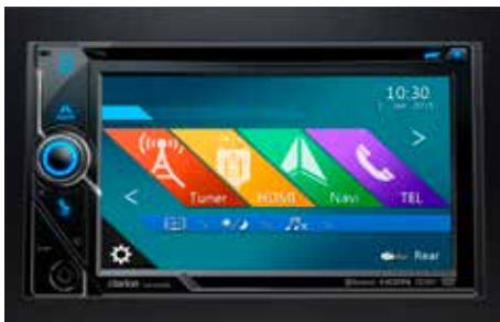
72 2DIN Multimediasystem Clarion NX405E 1290-33

Diebstahlschutz in speziellem Design für Ihre Felgen und Reifen. Das Kit besteht aus 16 schwarzen Radmuttern mit Subaru Logo, vier Felgenschlössern und einem speziellen Schraubenschlüssel.