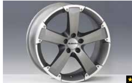
63 Leichtmetallfelge 8,0 x 18", ET 48 SEROFJ4000 *Nabenkappe zusätzlich notwendig.