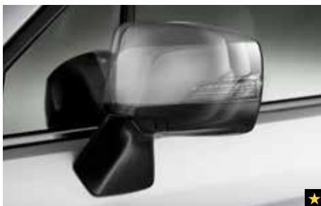
76 Außenspiegelanklappautomatik-Modul SEECAL3100

Plug & Play Soundupgrade Lösung, mit passgenauem Kabelsatz und integrierter Frequenzweiche. Digitaler ClassD 4 Kanal Verstärker, MOSFET Technik für brillanten Klang, RMS Ausgangsleistung an 4 Ohm = 4 x 50 Watt, max. Ausgangsleistung 300 Watt, Audiophile 2mm High End Hochtöner mit TETOLON Schwingspule und spielfreudigem NEODYM Magnet. *Nicht für Fahrzeuge mit Harman-Kardon-System.