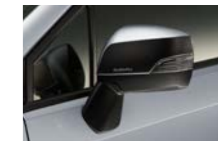
9 Dekorfolien für Außenspiegel (Schwarz/Silber) SEBDFJ3000/SEBDFJ3010 Verleiht den Außenspiegeln einen völlig neuen Look.