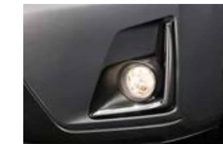
6 Nebelscheinwerfersatz H4510VA020 Für deutlich bessere Sicht bei schlechtem Wetter.