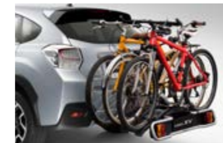
50 Fahrradaufsatz für Anhängerkupplung (3 Räder) E365EFJ400

Fahrradaufsatz für die Anhängerkupplung. Anhängerkupplung und Elektroeinbausatz 13-polig erforderlich.