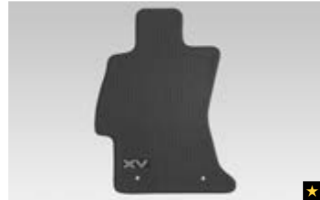
54 Teppichmattensatz vorne & hinten, Schwarz J505EFJ200 Verbessern Sie das Erscheinungsbild des Innenraums mit hochwertigen, passgenauen Teppichmatten mit Schriftzug.