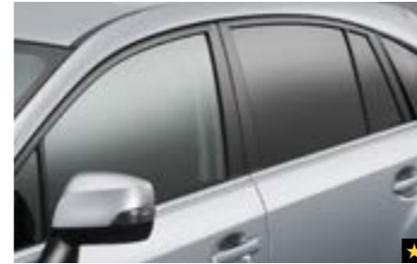
12 Chromoptik-Zierleisten Seitenfenster SEBDFJ3200 Betonnt die Seitenscheibenkontur durch die eleganten, attraktiven Chromzierleisten.