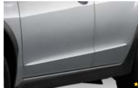
15 Chromoptik-Zierleisten Seitentüren E755EFJ100 Ein eleganter Chrom-Touch für die Seitentüren.