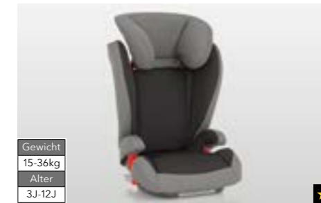
71 Kindersitz SUBARU ISOFIX Junior F410EYA217 Mit zusätzlichem Seitenaufprallschutz. Sichere Befestigung dank ISOFIX-System.