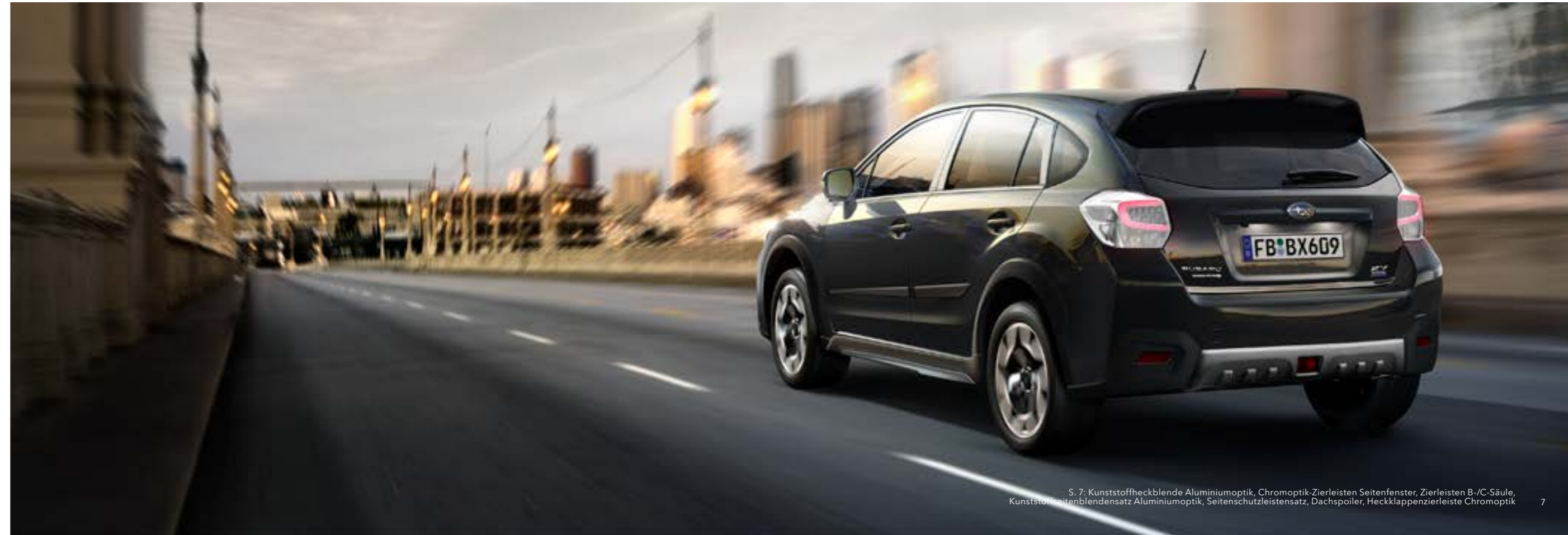
S. 7: Kunststoffheckblende Aluminiumoptik, Chromoptik-Zierleisten Seitenfenster, Zierleisten B-/C-Säule, Kunststoffseitenblendensatz Aluminiumoptik, Seitenschutzleistensatz, Dachspoiler, Heckklappen-zierleiste Chromoptik