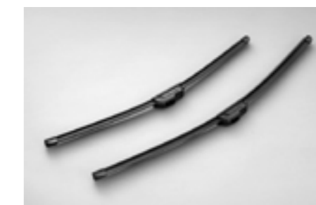
8 Premium Scheibenwischer "Aeroblades" SEBOFJ8000 Aerodynamisches Design für bessere Performance. *Set mit 2 Scheibenwischerblättern