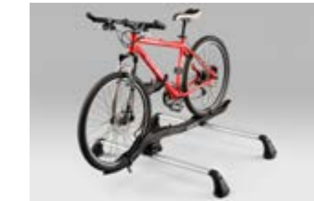
48 Fahrradaufsatz "Premium" E361ESA501

Für ein Fahrrad mit Rahmendurchmesser min. 20 - max. 65 mm, Reifenbreite max. 2,2" (56 mm), Radstand max. 114 cm. Einfache und elegante Befestigung des Fahrrades mittels Drehknopf. Verwendung mit Aluminium-Dachgrundträger.