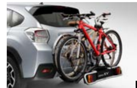
49 Fahrradaufsatz für Anhängerkupplung (2 Räder) E365EFJ200

Fahrradaufsatz für die Anhängerkupplung. Anhängerkupplung und Elektroeinbausatz 13-polig erforderlich.