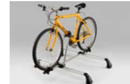
47 Fahrradaufsatz "Basic" E365ESC100

Für ein Fahrrad mit Rahmendurchmesser min. 30 - max. 80 mm, Reifenbreite max. 3,2" (81 mm), Radstand max. 114 cm. Leichte Befestigung des Fahrrades. Verwendung mit Aluminium-Dachgrundträger.