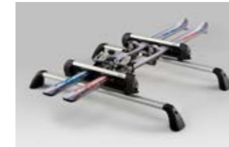
46 Ski-Aufsatz (max. 4 Paar Ski) E365EAG500

Für bis zu 4 Paar Ski oder 2 Snowboards. Verwendung mit Aluminium-Dachgrundträger. Nutzbare Breite: 350 mm.