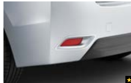
18 Heckreflektorzierleiste (Chrom-Look) SEBDFJ3300 Stilvoller Chromeinsatz für den Rückstrahler.