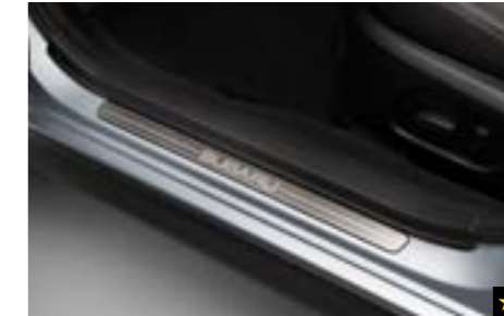
62 Türeinstiegsleistensatz (Edelstahl) E1010FJ100 Hochwertige Türeinstiegsleiste aus Edelstahl mit SUBARU-Schriftzug. *Set mit 2 Zierleisten.