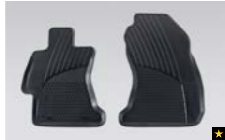
55 Gummimattensatz vorne J501EVA000 Strapazierfähige Gummimatten. Schützen den Boden vor Matsch und Schnee. *2-teiliges Set.