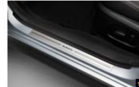
63 Türeinstiegsleistensatz (Kunststoff) SEBDFJ3500 Elegante Zierleiste mit Schriftzug, um den Türeinstiegsbereich aufzuwerten. *Set mit 2 Zierleisten