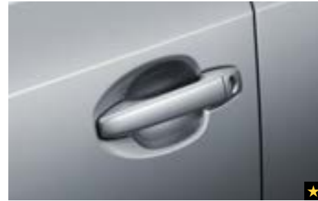
10 Griffmuldenschutzfolie SEZNF22000 Transparente Folie zum Schutz der Griffmulden vor Kratzern.

★ Alle Artikel, die mit diesem Symbol gekennzeichnet sind, können zu Preisvorteilspaketen zusammengefasst werden. Siehe Preisliste auf Seite 18/19 und Rückseite. Die Preise der jeweiligen Artikel entnehmen Sie bitte der Preisliste auf Seite 18/19.