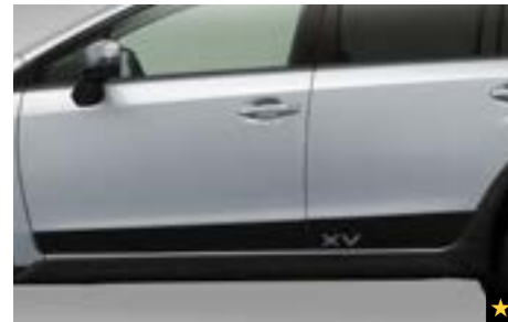
14 Stylingfolie (Schwarz/Silber) J125EFJ100/J125EFJ110 Ein weiterer Styling-Akzent und Schutz vor leichten Steinschlägen.