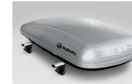
44 Dachbox (kurz) E361EYA802

Kurze 380l Dachbox (Abmessungen 1.792 x 797 x 355 mm). Verwendung mit Aluminium-Dachgrundträger.