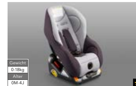
66 Kindersitz SUBARU GO/1S ISOFIX F410EYA012 Zur sicheren Befestigung mit nach hinten gerichtetem Blick. *Nutzung der ISOFIX-Haltpunkte durch Verwendung von F410EYA910.