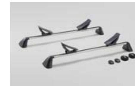
51 Kajak- und Bootaufsatz SETHAL7000

Für 1 Boot. Verwendung mit Aluminium-Dachgrundträger.