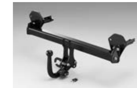
52 Anhängerkupplung (abnehmbar) L105EFJ000/L105EFJ101/1243

*Maximale Anhängelast kann je nach Fahrzeug variieren. Bitte fragen Sie Ihren Händler nach Details. Elektroeinbausatz zusätzlich notwendig.