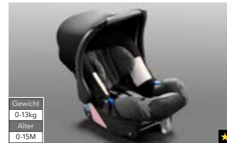
68 Kindersitz SUBARU Baby Safe Plus F410EYA105 Komplett mit Sonnenschutzdach.