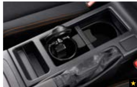
59 Aschenbecher (für Getränkehalter) 92172AG040/F6010SC000 Praktisch austauschbarer Aschenbecher. Passt in den Getränkehalter der Mittelkonsole. *92172AG040 für 5-Gang, F6010SC000 für CVT und 6-Gang.