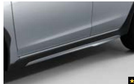
17 Kunststoffseitenblendensatz Aluminiumoptik E265EFJ200 Zur optischen Aufwertung der Fahrzeugseiten. Zum Schutz des Fahrzeugs vor Steinschlag.