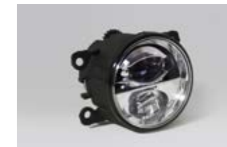
5 LED - Tagfahrleuchten SENOVA3000 Stilvolle und helle LED Leuchten mit integrierten Nebellampen für mehr Sicherheit am Tag und zur optischen Aufwertung der Fahrzeugfront.