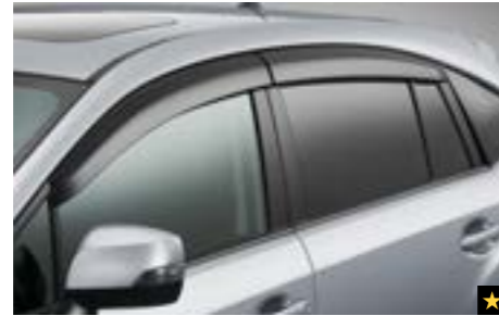
11 Seitenwindabweisersatz E3610FJ600 Verhindert bei schlechtem Wetter das Eindringen von Regen/Schnee beim Fahren mit leicht geöffnetem Fenster.