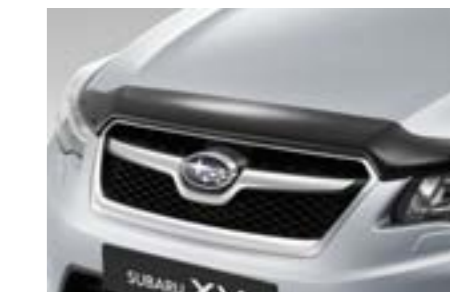
3 Motorhaubenschutz E235EFJ000 Schützt die Motorhaube vor Kratzern und Steinschlag.