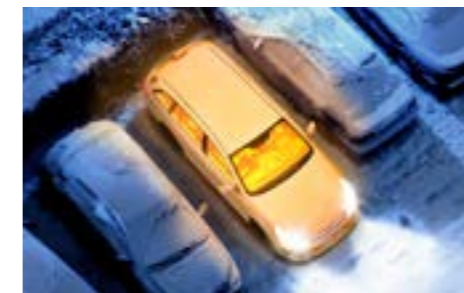
65 Standheizung Auf Anfrage Heizt den Motor vor und wärmt den Innenraum. Bitte fragen Sie Ihren Subaru Partner nach den Details.