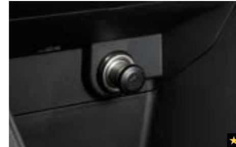
60 Zigarettenanzünder-Kit H6710FJ000 Der Zusatzstecker wird zum Zigarettenanzünder.