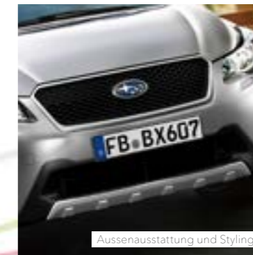
Aussenausstattung und Styling