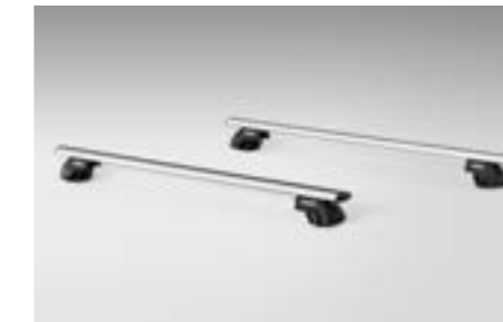
42 Aluminium-Dachgrundträger C-Slot E365EFG001

Perfekt in Design und Funktion. Ein leichtgewichtiger, stabiler Träger. *Für Fahrzeuge mit Dachreling.