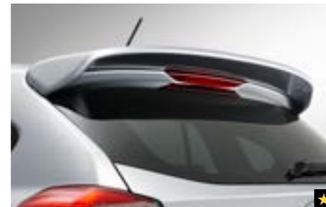
19 Dachspoiler E7210FJ600NN Verstärkt die ansprechende Aerodynamik und den sportlich starken Auftritt. *Lackierung erforderlich