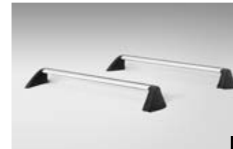
41 Aluminium-Dachgrundträger C-Slot E365EFJ500

★ Alle Artikel, die mit diesem Symbol gekennzeichnet sind, können zu Preisvorteilspaketen zusammengefasst werden. Siehe Preisliste auf Seite 18/19 und Rückseite. Die Preise der jeweiligen Artikel entnehmen Sie bitte der Preisliste auf Seite 18/19.