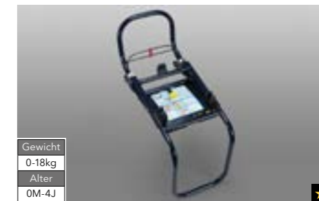
67 Kindersitz SUBARU GO/1S ISOFIX Plattform F410EYA910 Zur sicheren Befestigung von F410EYA012 mit nach hinten gerichtetem Blick unter Nutzung der ISOFIX-Haltpunkte.