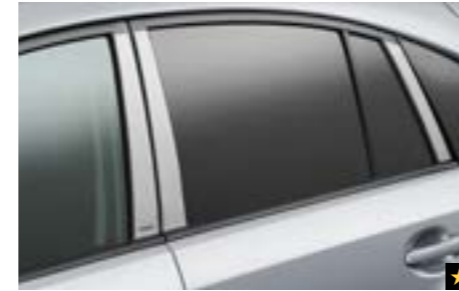
13 Zierleisten B-/C-Säule SEBDFJ3400 Stilvolle Zierleisten in matter Silberoptik für die B- und C-Säule.