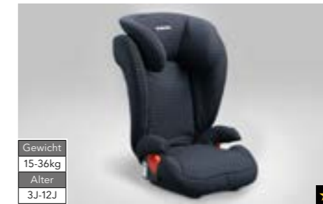
70 Kindersitz SUBARU Junior Plus F410EYA216 Mit zusätzlichem Seitenaufprallschutz.