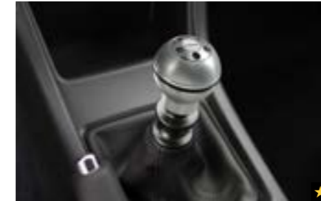
61 Aluminiumsportschaltknopf (6-Gang Schaltgetriebe) C105ESC000 Stilvoller Aluminiumschaltknopf mit SUBARU Schriftzug.