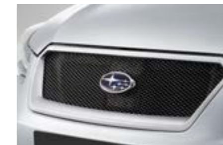
2 Gitterfrontgrill J1010FJ00NN Maschengittereinsatz, der der Front ein ganz neues Aussehen verleiht. *Lackierung erforderlich