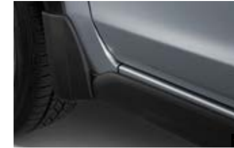
21 Schmutzfängersatz vorne J101CFJ251 Verhindert, dass Matsch, Schnee, Teer, Steine usw. an die Karosserie gelangen.