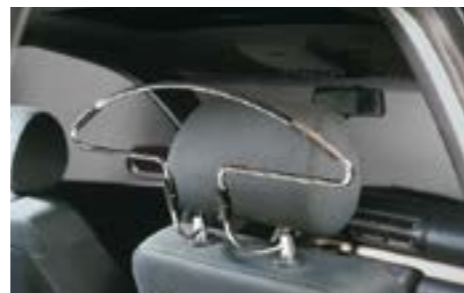
58 Autokleiderbügel zur Kopfstützenmontage 2405 Zum Aufhängen von Kleidungsstücken. *Montage an der Kopfstütze.