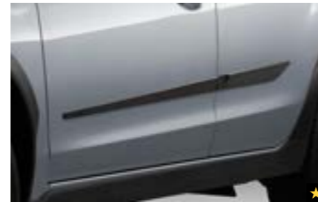
16 Seitenschutzleistensatz J105EAJ103 Ergänzt die Designelemente und schützt die Karosserie-seite.