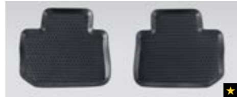
56 Gummimattensatz hinten J501EVA010 Strapazierfähige Gummimatten. Schützen den Boden vor Matsch und Schnee. *2-teiliges Set.