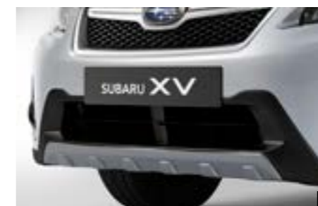
7 Kunststofffrontblende Aluminiumoptik E555EFJ101 Zur optischen Aufwertung der Fahrzeugfront. Zum Schutz des Fahrzeugs vor Steinschlag.