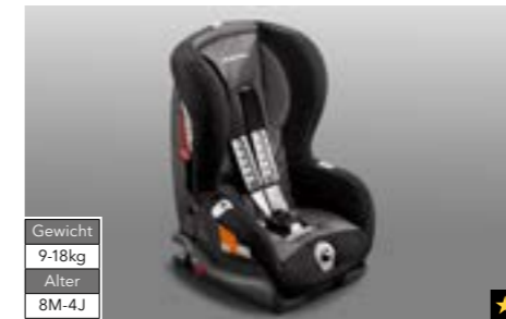
69 Kindersitz SUBARU Duo ISOFIX Plus F410EYA003 Sichere Befestigung dank ISOFIX-System.