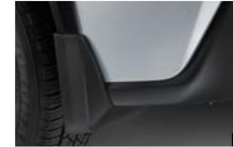
22 Schmutzfängersatz hinten J101CFJ254 Verhindert, dass Matsch, Schnee, Teer, Steine usw. an die Karosserie gelangen.