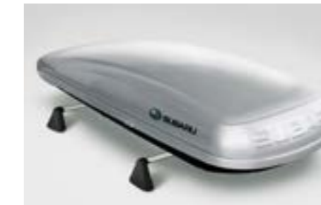
43 Dachbox (lang) E361EYA901

Lange 430l Dachbox (Abmessungen 2.267 x 805 x 355 mm). Verwendung mit Aluminium-Dachgrundträger.