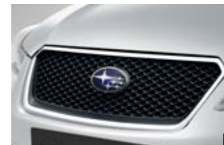
1 Gitterfrontgrill J1010FJ050 Maschengittereinsatz, der der Front ein ganz neues Aussehen verleiht. *Nicht für Diesel.

★ Alle Artikel, die mit diesem Symbol gekennzeichnet sind, können zu Preisvorteilspaketen zusammengefasst werden. Siehe Preisliste auf Seite 18/19 und Rückseite. Die Preise der jeweiligen Artikel entnehmen Sie bitte der Preisliste auf Seite 18/19.