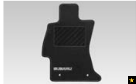
53 Teppichmattensatz vorne & hinten, Standard J505EFJ100 Teppichmatte mit Schriftzug, genaue Passform.

★ Alle Artikel, die mit diesem Symbol gekennzeichnet sind, können zu Preisvorteilspaketen zusammengefasst werden. Siehe Preisliste auf Seite 18/19 und Rückseite. Die Preise der jeweiligen Artikel entnehmen Sie bitte der Preisliste auf Seite 18/19.