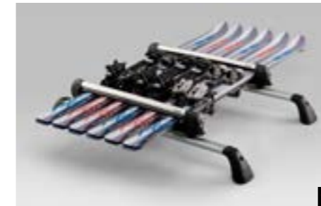
45 Ski-Aufsatz (max. 6 Paar Ski) E361EAG550

Für bis zu 6 Paar Ski oder 4 Snowboards. Verwendung mit Aluminium-Dachgrundträger. Nutzbare Breite: 640 mm.