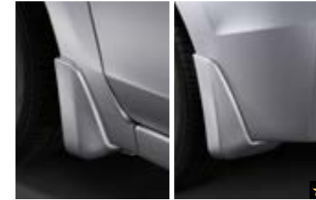
20 Schmutzfängersatz J1010FJ200NN Verhindert, dass Matsch, Schnee, Teer, Steine usw. an die Karosserie gelangen. *Lackierung möglich