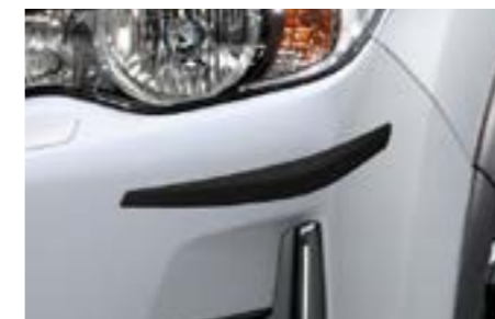
4 Stoßfängerschutzzeckensatz (vorne & hinten) J105EFJ000 Ergänzt die Designelemente und schützt die Stoßfängerecken vor Kratzern. *Nicht in Verbindung mit Einparkhilfe vorne. *4-teiliges Set.