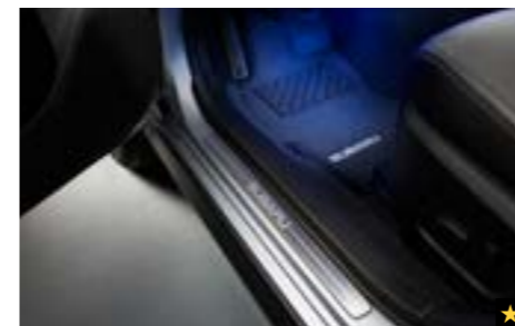
64 Innenraumbeleuchtungsset (Blau) H701SFJ001 Beleuchtet den Fußraum Ihres Levorg mit einem strahlend blauem Schimmer.