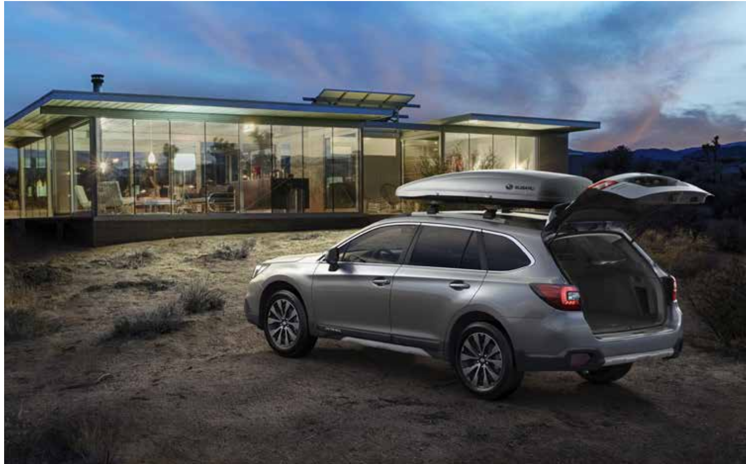
S. 13: Kunststoffseitenblendensatz Aluminiumoptik, Kunststoffheckblende Aluminiumoptik, Aluminium-Dachgrundträger C-Slot, Dachbox.