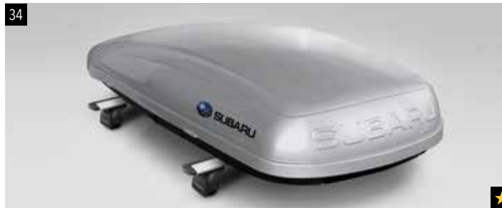
34 Dachbox (kurz)

Lange 430l Dachbox (Abmessungen 2267 x 805 x 355mm). Verwendung mit Aluminium-Dachgrundträger.