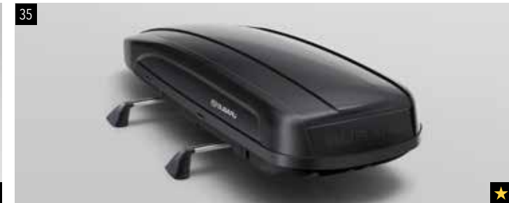
35 Dachbox (Sport)

Kurze 380l Dachbox (Abmessungen 1792 x 797 x 355mm). Verwendung mit Aluminium-Dachgrundträger.