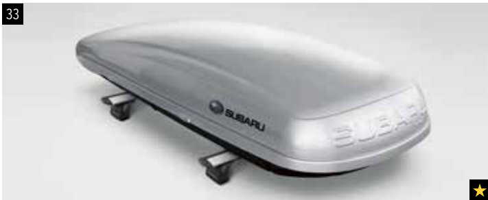
33 Dachbox (lang)