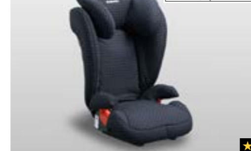
79 Kindersitz SUBARU Junior Plus F410EYA214