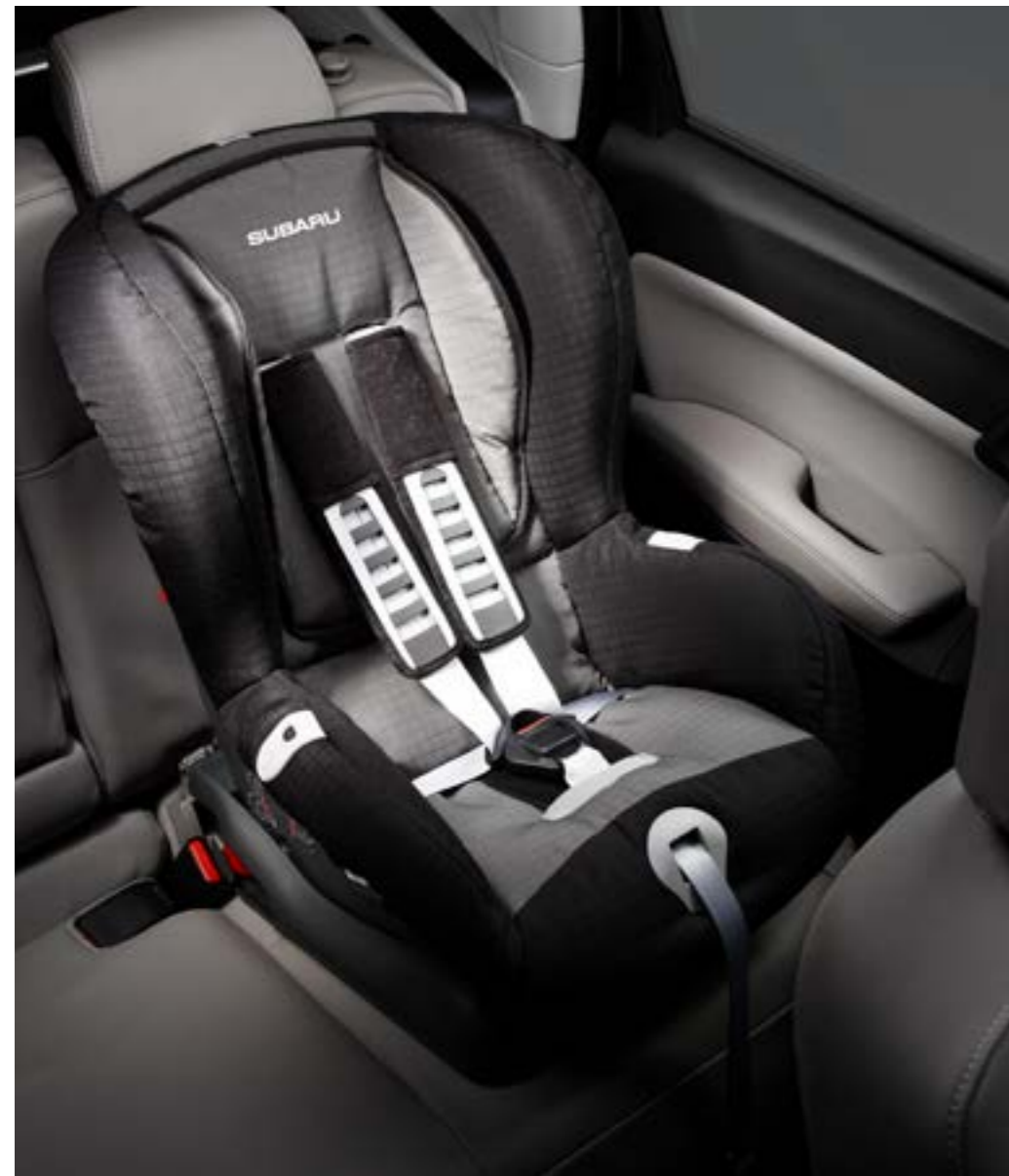
77 Kindersitz SUBARU Baby Safe Plus F410EYA105

Komplett mit Sonnenschutzdach. *Nutzung der ISOFIX-Haltepunkte durch Verwendung von F410EYA900.