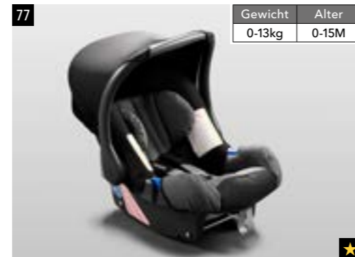
79 Kindersitz SUBARU Junior Plus F410EYA214

Komplett mit Sonnenschutzdach. *Nutzung der ISOFIX-Haltepunkte durch Verwendung von F410EYA900.