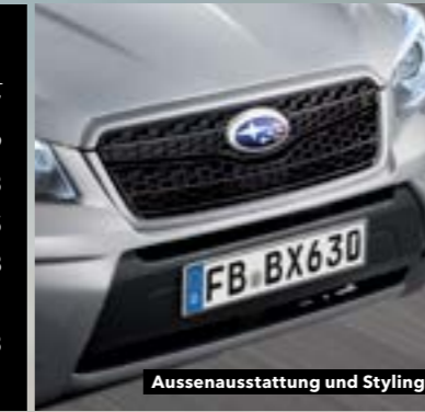
Aussenausstattung und Styling