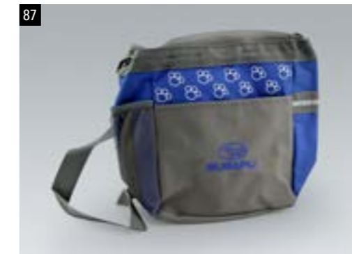
87 SUBARU Haustier Utensilien-Set 1531

Reiseset für Tiere: Reißverschluss tasche und zwei faltbare Schüsseln für Tiernahrung und Wasser. Vorderes Steckfach mit Klettverschluss, Seitentasche aus Mesh-Gewebe, abnehmbare Reißverschluss tasche für Leckerli, Müllbeutel etc.