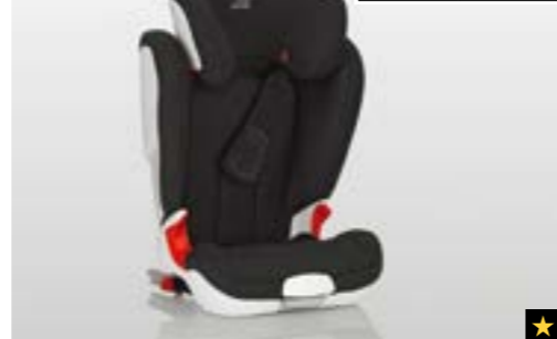
80 Kindersitz SUBARU ISOFIX Junior XP F410EYA230

Mit zusätzlichem Seitenaufprallschutz. Sichere Befestigung dank ISOFIX-System.