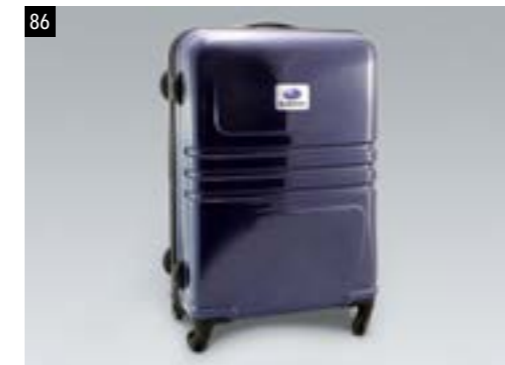
86 SUBARU Rollkoffer, 64 cm 1527

Rollkoffer aus hochwertigem Polycarbonat mit 4 drehbaren Rollen, ausziehbarem Griff, Zahlenschloss, Trennwand mit Netzfach und elastischen Packriemen. Höhe mit eingeschobenem Griff ca. 64 cm. Maße 58 x 46 x 24 cm. Volumen ca. 62 Liter.