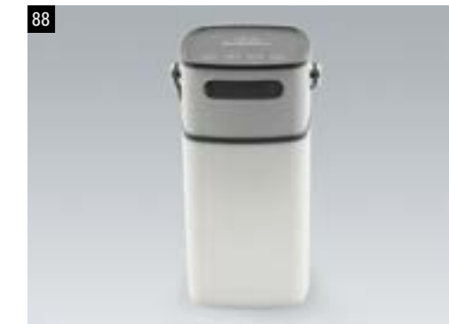
88 SUBARU Bluetoothlautsprecher LANTERN 1532

Weiches Licht und sanfte Klänge - was braucht man für einen schönen Sommerabend im Freien mehr? Der LANTERN SPEAKER mit Bluetooth V 2.1 und 5W starkem Lautsprecher verbindet beides in einem modernen, zeitlosen Design. Kabellos, edel und extrem praktisch! Maße 12,3 x 12,3 x 23 cm.