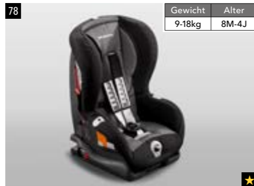
80 Kindersitz SUBARU ISOFIX Junior XP F410EYA230