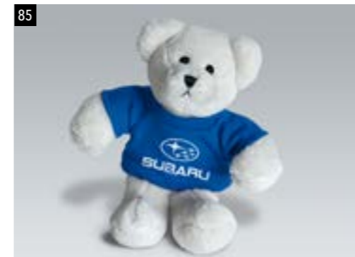
85 SUBARU ÖKO - Tex Plüschbär 2921

Flauschiger Teddy im T-Shirt zum Knuddeln.