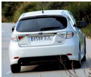
Kurvige Strecken machen mit dem tollen Fahrwerk und dem mutigen VDC viel Spaß