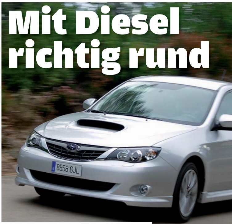
Schwellerwülste, Spoilerlippe und die 17-Zöller gehören zum Sport-Paket

Denen kann jetzt geholfen werden. Ab Januar kommt auch der Impreza mit dem viel gelobten Boxer-Diesel zu den Händlern. Dieser Selbstzünder mit zwei Liter Hubraum und regeltem Rußfilter verspricht beeindruckende Sparsamkeit: Wer mit dem Normverbrauch auskommt – was ruhigen Fahrern bei den bisherigen Subaru-Diesel-Modellen durchaus gelingt –, darf sich über Reichweiten von gut 1000 km mit einer Tankfüllung freuen.