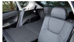
Für die Laderaumerweiterung werden nur die Rücksitzlehnen geteilt geklappt