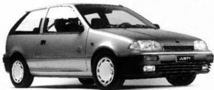
Justy 1,3 GX, 3-Türer, Allradantrieb