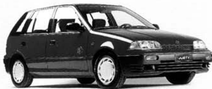
Justy 1,3 GX, 5-Türer, Allradantrieb