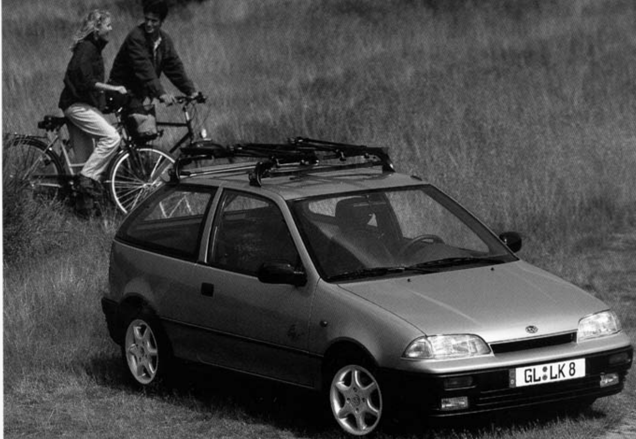
Der neue Justy 1,3 GX, permanenter Allradantrieb, 3-türig. Sonderausstattung: Alufelgen, Dachspoiler, Dachträger, Nebellampen.