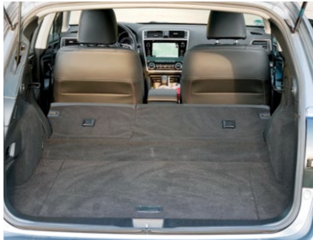
Die Ledersitze sind elektrisch einstellbar, Vorder- und Rücksitze sind beheizbar. Umgeklappt können bis 2,04 Meter geladen werden.