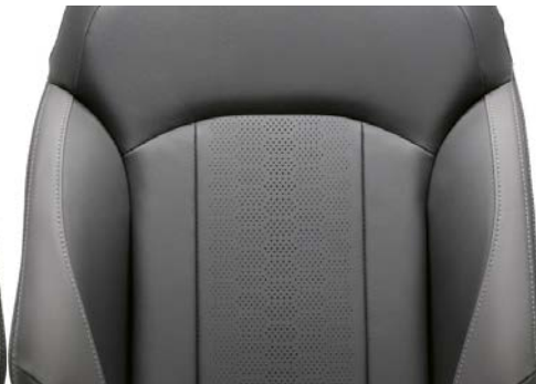
Leder schwarz/grau mit Teilflächen in Kunstleder