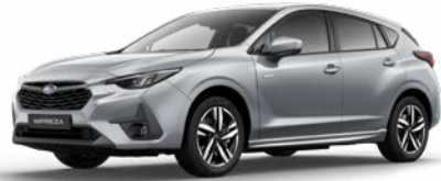
Ice Silver Metallic