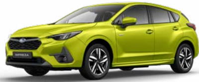
Citron Yellow Pearl