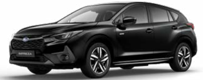
Crystal Black Silica