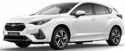
Crystal White Pearl