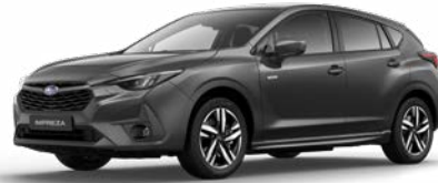
Magnetite Grey Metallic