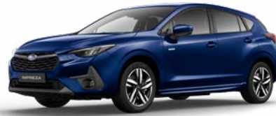
Sapphire Blue Pearl