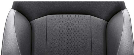
Ledersitze* schwarz/grau Kontrastnähte silber