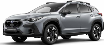
Ice Silver Metallic