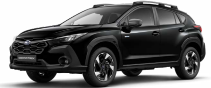
Crystal Black Silica