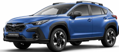
Daybreak Blue Pearl