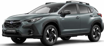
Offshore Blue Metallic