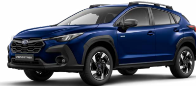
Sapphire Blue Pearl