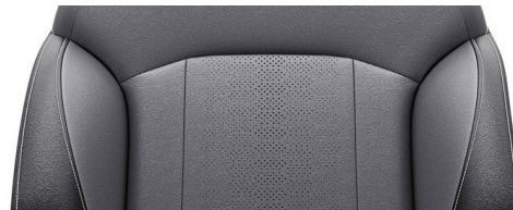
Ledersitze* grau/schwarz Kontrastnähte silber