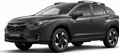
Magnetite Grey Metallic