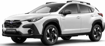
Crystal White Pearl