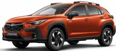
Sun Blaze Pearl